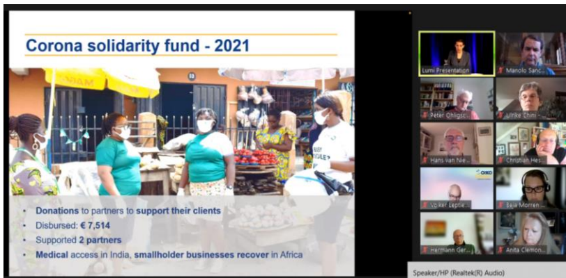
Asamblea General del 9 de Junio de 2022