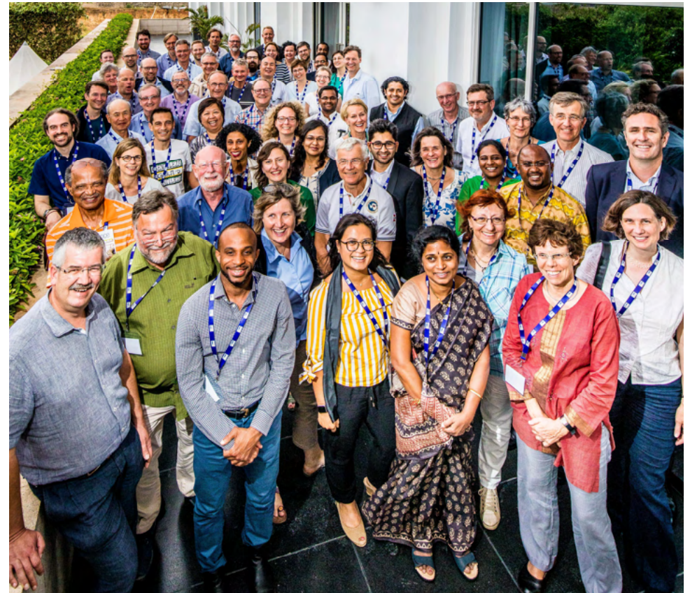
Asamblea General Mundial 2018, India.