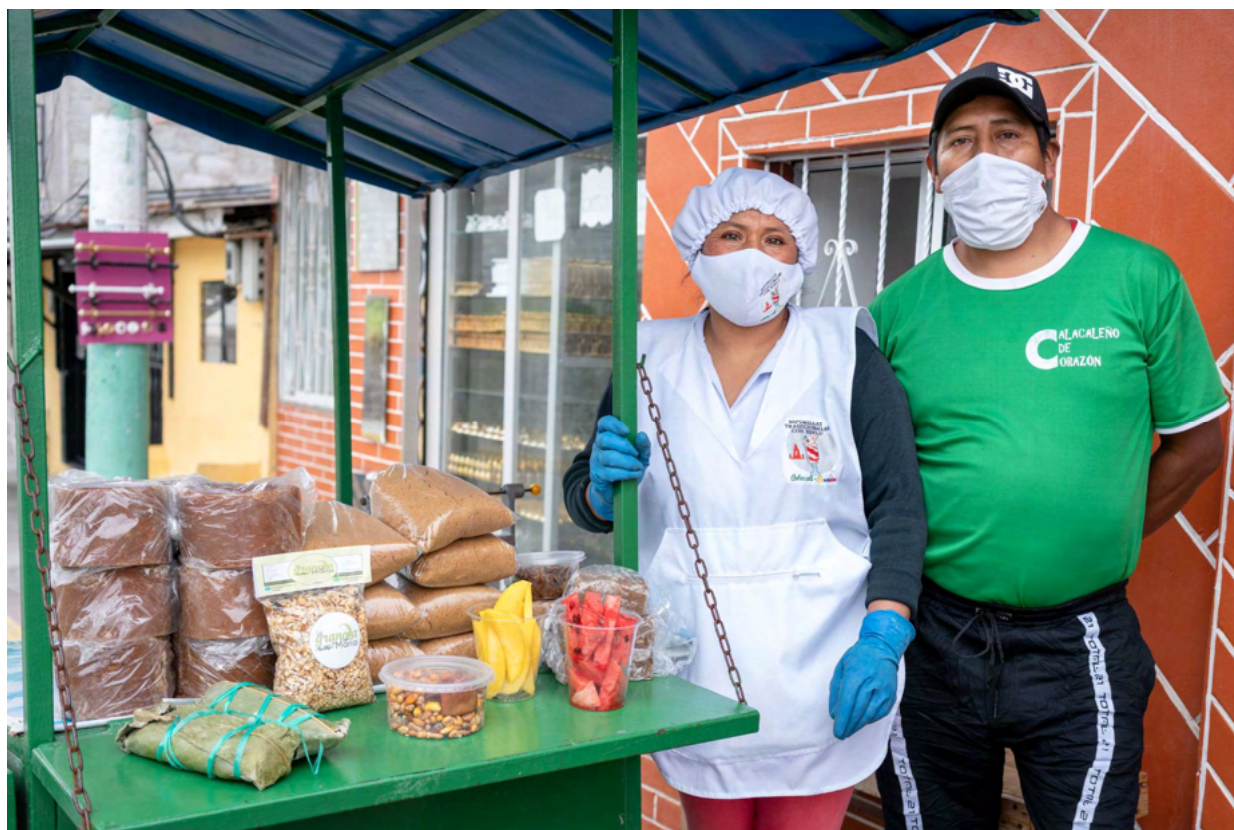
Cooperativa de Ahorro y Crédito Cooprogreso Ltda.(Ecuador)

Agradecemos la confianza y compromiso de todos/as los/as socios/as con la labor de transformación social que persigue Oikocredit, durante este 2020 especialmente incierto.